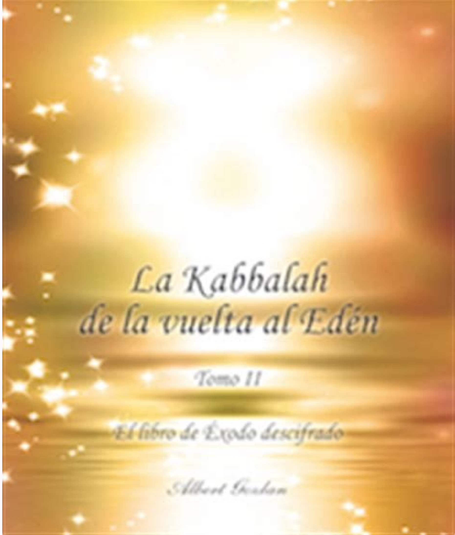
Kabbalah mashiah libros pdf. Libros de kabbalah mashiah.